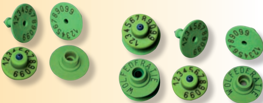
Vrouwelijk deel met extra bedrukking (optie)