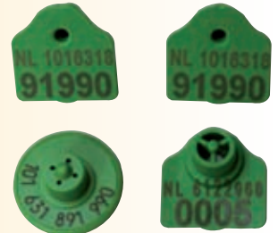
Vrouwelijk deel met extra bedrukking. UBN nr. & volgnummer (deel rechtsonder)